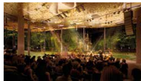
Erzsébetváros 2018. december 13.