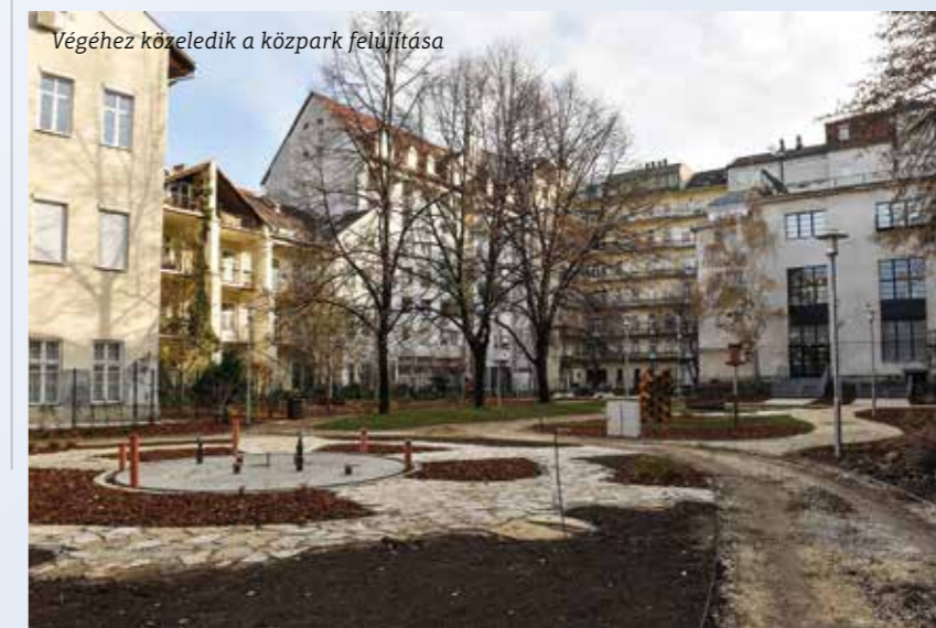
Végéhez közeledik a közpark felújítása

A Dob utca 86. szám alatti orvosi ügyelet felújítása júliusban kezdődött. A korszerűsítés során az erzsébetvárosi és terézvárosi lakosság ügyeleti ellátását biztosító rendelő teljes belső felújítását elvégzik. Kicserélik a külső nyílászárókat a szükséges homlokzati rekonstrukciók elvégzésével, és új burkolatokat is leraknak. A rendelő teljes épületgépészeti modernizációját is elvégzik, ezzel egyrészt az érkező betegek ellátása is korszerű körülmények között történhet, illetve az ügyeletet adó dolgozók elhelyezése is kényelmesebbé válhat.