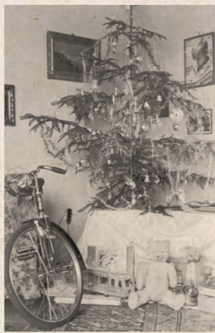
Erzsébetváros 2018. december 13.

Eközben a VII. kerület üzemei és a kerület lakossága nevében a kerületi tanács végrehajtó bizottsága – a szénellátás leállítás miatt beállt munkaleállás és energiahány miatt – kiáltvánnyal fordult a bányászok felé: „A ti otthonotok meleg, de a mi gyermekeink fáznak! Nektek lesz munkalehetőségetek, megélhetésetek, de nekünk el kell bocsájtanunk munkástestvéreinket miattatok! Nálatok