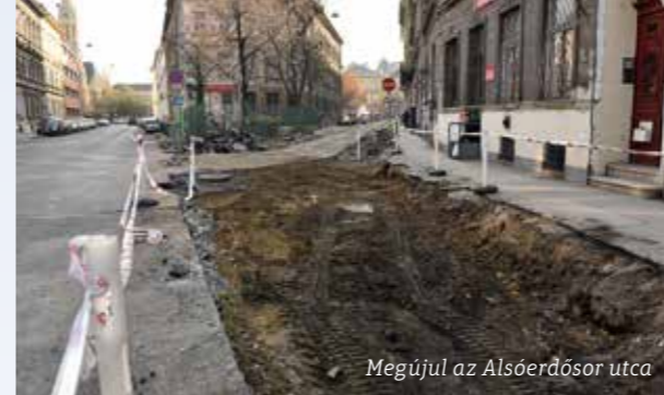
Megújul az Alsóerdősor utca

Az utca nagy részén érvényes szabályozási szélesség miatt jellemzően helyben