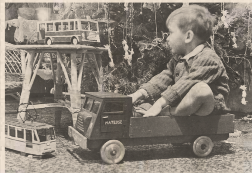
Erzsébetváros 2018. december 13.

Bár a karácsony szó a címlapon megmaradt, a Népszabadság egy évvel későbbi száma már nem volt karácsonyi szám. Az újságból eltűnt